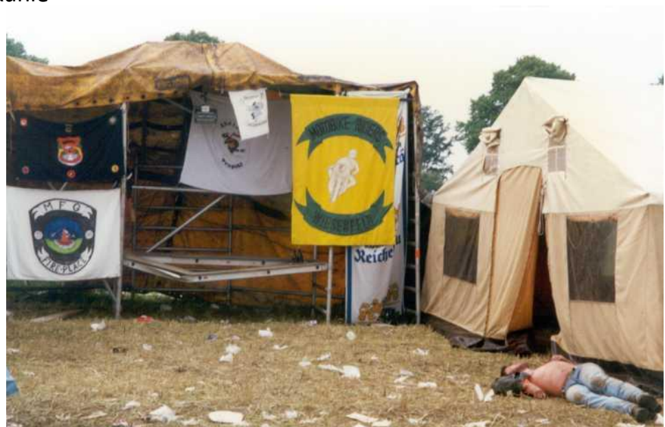
Wenn das der TÜV gesehen hätte ☺

Die TURTLES laden ein Zum Motorrad-Treffen Am 09. - 11. Sept. 1998 Ort: Witzhave Handwritten notes: Anfahrt: Richtung Ohe Punkte reichlich Pferdeströme Nennung: 5.-DM Puls Speise Kutter Sonne Reiche