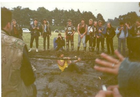
Tauziehen in einer eigens dafür hergerichteten Schlammkuhle